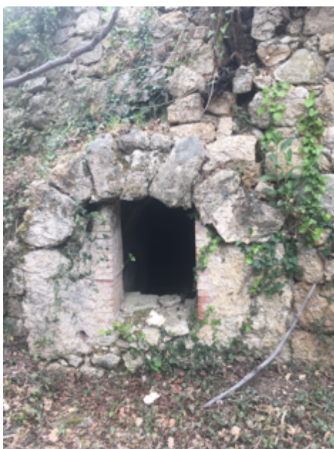
A Callian, quartier du Purgatory, une source fut aménagée. Elle est sèche en ce début avril 2019