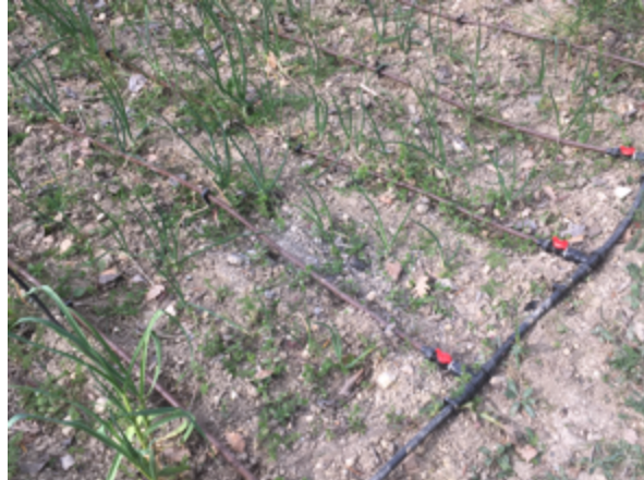
J. Gault arrose ses (jeunes) oignons au goutte à goutte

Proposition n° 1 : encourager les cultivateurs (professionnels, ou amateurs), à recourir à des techniques, des cultures, des calendriers, économes en eau.